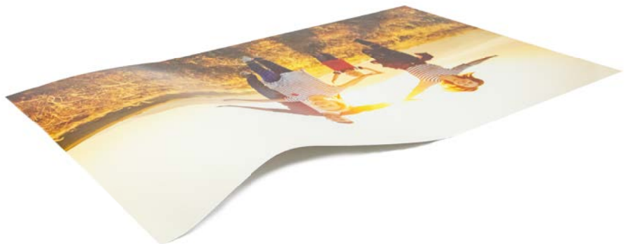
Poster matt laminiert

Schutz vor Kratzer und Wasserspritzer. Besonders edler Look, keine Spiegelungen.